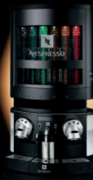
Version à poser